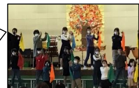
5年生 「ダイナマイト」