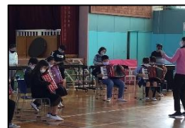
6年生 「届け！音楽の力 ～世界に一つだけの 私たちの音色～」