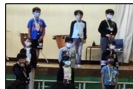
3年生 「はじめましてリコーダー」

11月11日から2日間にわけて、音楽発表会を行いました。今年度は3～6年生がクラスごとに発表しました。一人一人が練習の成果を発揮しながら、すばらしい音楽を奏でていました。